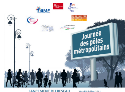
LANCEMENT DU RESEAU Mardi 5 juillet 2011

C'est une structure supra-intercommunale de nature syndicale qui respecte les périmètres des membres adhérents et fonctionne au moyen de contributions budgétaires.