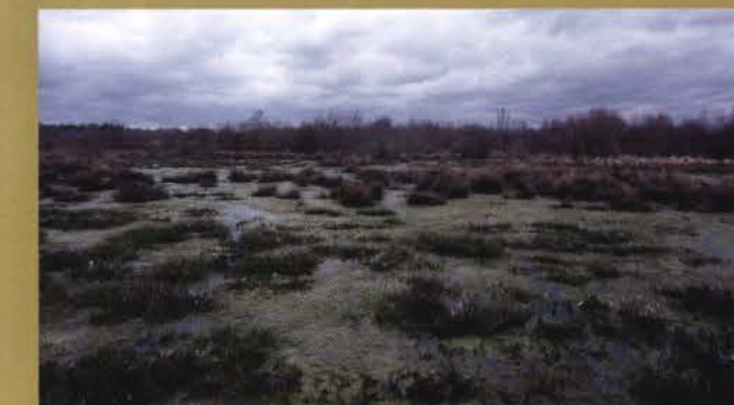
Les zones humides constituent de véritables stations d'épuration naturelles quand l'eau y séjourne suffisamment longtemps