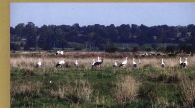
Une grande partie de la biodiversité régionale est liée aux zones humides