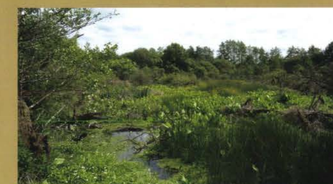
En été, ce sont les zones humides qui alimentent le débit des cours d'eau, permettant ainsi de nombreux usages : agriculture, chasse, pêche, loisirs, alimentation du bétail et de la population.